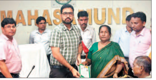
राशन कार्ड हेतु आवेदन किए, जिस पर तत्काल कार्रवाई करते हुए कलेक्टर द्वारा आज ही जन चौपाल में राशन कार्ड प्रदान किया गया।