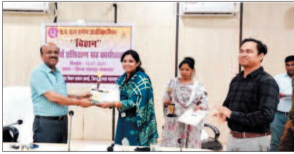
हरिभूमि न्यूज ►► महासमुंद